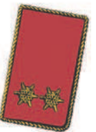
2 goldgestickte Sternrosetten. Aufschlag mit gedrehter Goldschnur eingefasst