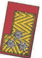
Goldbrokatfeld mit rotem, 1 cm breiten Tuchvorstoß und 3 silbergestickten Sternrosetten