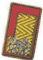
Goldbrokatfeld mit rotem, 1 cm breiten Tuchvorstoß und einer silbergestickten Sternrosette, diese umgeben von einem Eichenlaubkranz. Der Aufschlag ist mit gedrehter Goldschnur eingefasst

B: Ernennung durch den Landesfeuerwehrkommandanten gemäß § 21 Abs. 2 StFWG