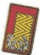
Goldbrokatfeld mit rotem, 1 cm breiten Tuchvorstoß und einer silbergestickten Sternrosette, diese umgeben von einem Eichenlaubkranz. Der Aufschlag ist mit gedrehter Goldschnur eingefasst