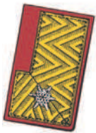
Goldbrokatfeld mit einer silbergestickten Sternrosette