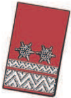
15 mm breite und 7 mm breite Silberborte an der vorderen Seite und 2 silbergestickte Sternrosetten