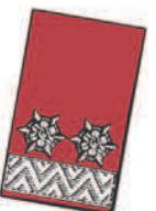
15 mm breite Silberborte an der vorderen Seite und 2 Weißmetall-Sternrosetten