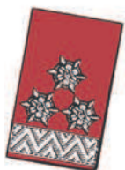
15 mm breite Silberborte an der vorderen Seite und 3 Weißmetall-Sternrosette