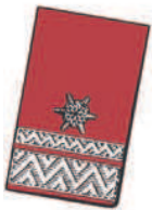
15 mm breite und 7 mm breite Silberborte an der vorderen Seite und 1 silbergestickte Sternrosette