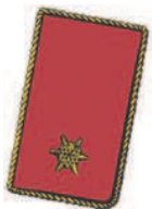
1 goldgestickte Sternrosette. Aufschlag mit gedrehter Goldschnur eingefasst