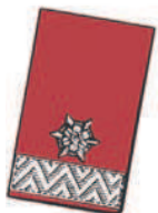
15 mm breite Silberborte an der vorderen Seite und 1 Weißmetall-Sternrosette