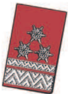
15 mm breite und 7 mm breite Silberborte an der vorderen Seite und 3 silbergestickte Sternrosetten