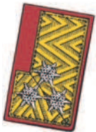
Goldbrokatfeld mit 3 silbergestickten Sternrosetten