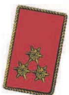
3 goldgestickte Sternrosetten. Aufschlag mit gedrehter Goldschnur eingefasst