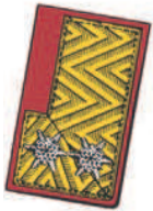
Goldbrokatfeld mit 2 silbergestickten Sternrosetten

B: von einer Wahlversammlung gewählt bzw. vom Bereichsfeuerwehrkommandanten zum KHD-Bereitschaftskommandanten ernannt